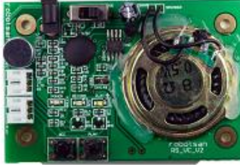
Ses Kontrol Kartı